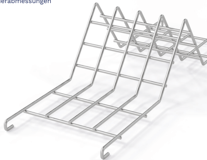
GIDRA® PART PAL